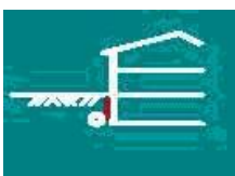
Pereti de subsol

Cei mai multi constructori profesionisti, atunci cand vor sa fie foarte eficienti in instalare, montare si in acelasi sa fie la un pret foarte bun aleg ca si solutie Enkagrid® Standard, in special la proiectele de constructii de dimensiuni mici si mijlocii.