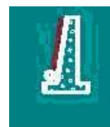
pereti de sustinere