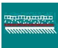
suprafete de parcare