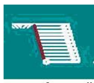
ascuns dupa peretii de sustinere