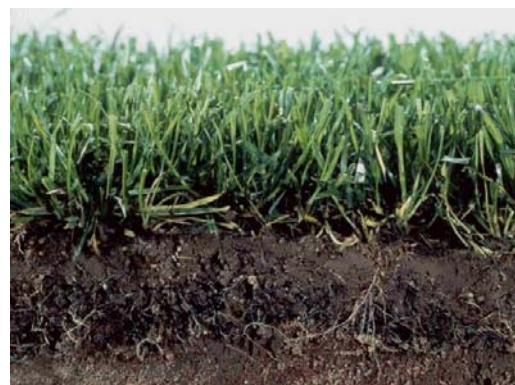
Ranforsare permanenta pt radacini