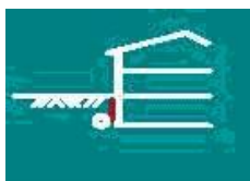
Pereti de subsol