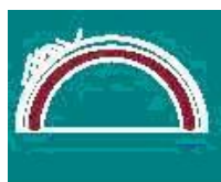
drenare pt tuneluri