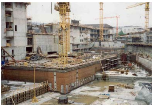
Lost shuttering, Stuttgart, Germania

Cand banca germana Südwest LB (azi LBBW) a construit un nou sediu de afaceri de 11 etaje in centrul orasului Stuttgart, problemele de constructii le-au pus la incercare pe ingineri. Locatia era in apropiere de alte trei parti de cladiri, iar etajele inferoare aflate la 16m adincine (3 etaje) trebuiau izolate de cladirile adiacente si de drumul invecinat cu drenaj suficient pt apele subterane.